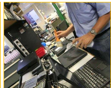
Une intervention d'Actif Azur dans les locaux d'Inria

La proposition d'Actif Azur s'est avérée être plus pertinente selon la grille d'analyse privilégiant le taux horaire pratiqué.