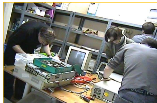
Chantier d'insertion Infosel